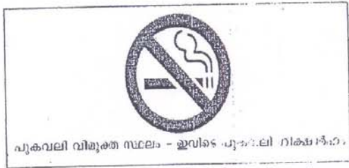
ആരെയും പുകവലിക്കുന്നത് കണ്ടാൽ ഈ വിഭാഗത്തിൽ പരാതിപ്പെടാം.

1. “പുകവലി വിമുക്ത സ്ഥലം - ഇവിടെ പുകവലി ശിക്ഷാർഹം” എന്ന് മലയാളത്തിൽ എഴുതിയ 60 സെ. മീ x 30 സെ.മീ വലിപ്പത്തിലുള്ള ബോർഡുകൾ കോട്പ 4-30 വകുപ്പു പ്രകാരം വിദ്യാലയത്തിന്റെ പ്രവേശന കവാടത്തിൽ ശ്രദ്ധിക്കുന്ന തരത്തിൽ പ്രദർശിപ്പിക്കണം.